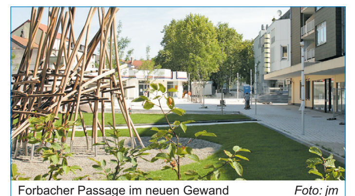
Forbacher Passage im neuen Gewand

standenen Entwürfe vor. Die Kinderbetriebsbörse Völklingen informiert über ihr Leistungsangebot. Im ehemaligen Sporthaus Lentz kann an diesem Tag auch die Ausstellung der Mal- und Ytongruppe Wehrden besucht werden. Organisiert wird das Fest vom Fachdienst 26 und der Stadtteilmanagerin der Stadt Völklingen. Alle Bürgerinnen und Bürger sind herzlich eingeladen.