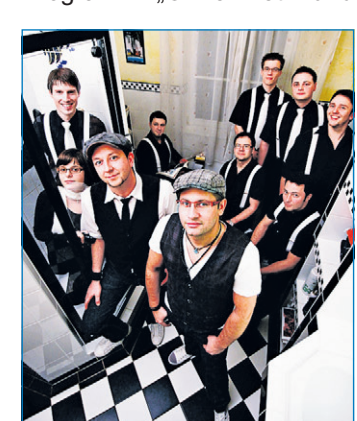
Pop- und Swing-Sensation des Jahres: die Band „Grossartig“

doppelten Boden“, das Wed- deli Köhler Ensemble mit „Sinti-Jazz“ sowie zum Abschluss Celia Malheros mit brasilianischer Musik zwischen Rio und San Francisco. Eintrittskarten zu „Carbon & Stahl“ können einzeln oder aber auch kostengünstig im Abonnement erworben werden.