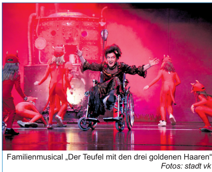
Familienmusical „Der Teufel mit den drei goldenen Haaren“

sikbühne Mannheim mit dem Familienmusical „Der Teufel mit den drei goldenen Haaren“, das „Revue-Orchester 1920“ mit Unterhaltungsmusik aus den späten 20er und 30er Jahren sowie die „Pop- und Swing-Sensation des Jahres“, die Band „Grossartig“, im Rahmen ihrer „Was ich brauch...“-Tournée 2010 auftreten. Im ersten Halbjahr 2011 ist die bundesweit sehr erfolgreiche A-Capella-Formation „Viva Voce“ mit ihrem Programm „Tapetenwechsel – Frisch gestrichen“ zu Gast. Die fünf Jungs haben gemeinsame Wurzeln beim Windsbacher Knabenchor und sind Träger des bayerischen Kulturpreises 2009.