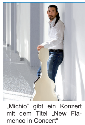
„Michio“ gibt ein Konzert mit dem Titel „New Flamenco in Concert“

Hochkarätig wird auch das Programm in den anderen Veranstaltungsstätten sein: So gibt der Künstler „Michio“ am 22. Oktober ein Konzert mit dem Titel „New Flamenco in Concert“ in der Verdichterhalle. Michio ist einer der gefragtesten Vertreter dieser Musik außerhalb Spaniens. Unter anderem wird auch das Erz-Rock-Festival und das Klassik-Festival „Concertare“ in der Gebläsehalle Station machen. In der Kulturhalle wird die Mu-