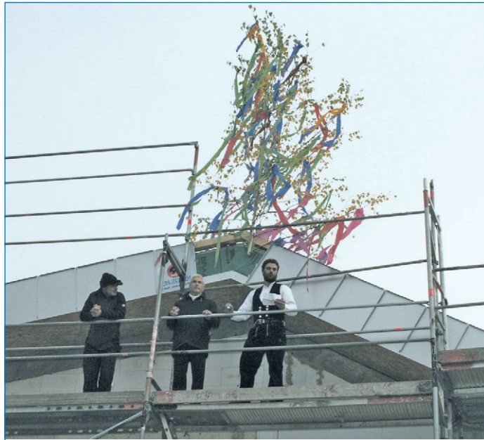
Die Arbeiten am Rohbau sind abgeschlossen

„Die Familien in unserer Stadt können sich auch im nächsten Jahr über neue Angebote im Bereich der Kindertagesstättenbetreuung freuen“, verkündete Oberbürgermeister Klaus Lorig anlässlich des Richtfestes der Kindertagesstätte neben der Grundschule Haydnstraße. „Nach der Fertigstellung im Sommer 2011 werden hier 100 Kindergartenkinder und 20 Krippenkinder im Alter von 0 bis 3 Jahren neuen Raum finden“, erläuterte der Verwaltungschef die Pläne. Um dieses Kontingent stemmen zu können, werden im Erdgeschoss des modern und flexibel gestalteten, zweigeschossigen Neubaus vier Gruppenräume und zwei weitere im Obergeschoss eingerichtet werden. Zusätzlich zu den vier Gruppenräumen sind im Erdgeschoss Sanitärbereiche für Kinder und Personal, ein Technikraum und eine Küche geplant. Die beiden Gruppenräume im Obergeschoss werden über eine einläufige Stahltrappe zu erreichen sein. Um einen reibungslosen Kindergartenbetrieb zu gewährleisten und lange Wege zu vermeiden, sind auch im Obergeschoss Sanitärbereiche vorgesehen. Über zwei vorgelagerte Brücken werden die Kinder zum Spielen an die