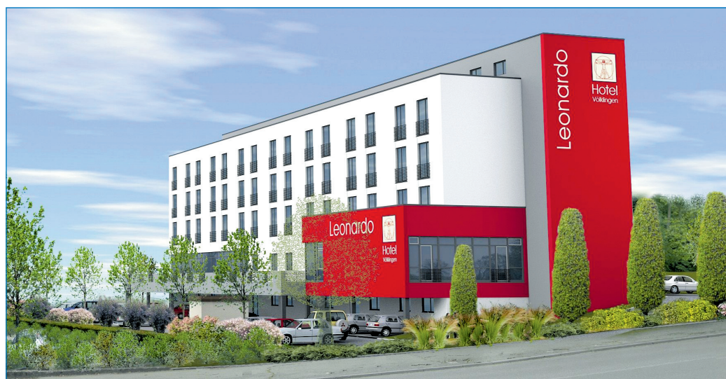
So wird das neue Hotel in Völklingen aussehen.