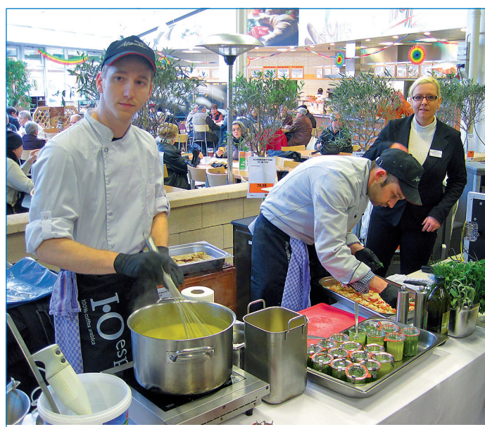
Frühjahrsimpressionen aus der Gourmetküche des Parkhotel Albrecht