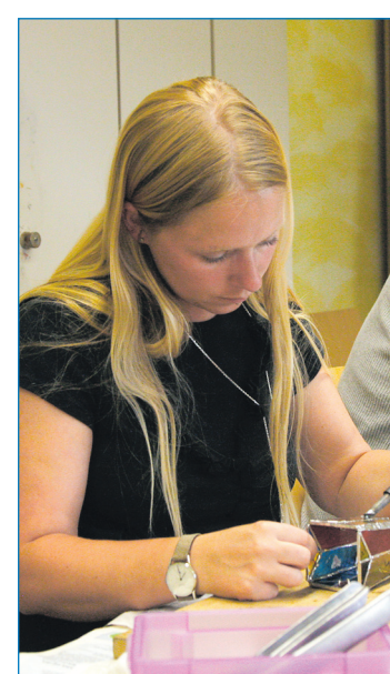
Teilnehmer des Kurses „Tiffany“ lernen auch das Lötten

Kursen fortgesetzt. Immer größer wird das Angebot im Fachbereich Gesundheit. Dabei bleiben die Entspannungstechniken Yoga, Tai Chi Chuan und Qi Gong im Fokus. Für Gestresste können die Angebote Hypnose, Selbsthypnose, Leben in Balance oder das Seminar „Stress lass nach!“ helfen. Im Bewegungsbereich gilt es seine Vorlieben auszuwählen: Laufen, Schwimmen, Walken oder Haltungs- und Wirbelsäulengymnastik, Wassergymnastik oder sogar Stepp-Aerobic. Spezielle Themen wie Abnehm-Gymnastik oder Bauchtanz kann man ebenso finden wie das Thema „Fit und entspannt in den Abend“. Im Rahmen von „Völklingen lebt gesund!“ – das Projekt wird von der Volkshochschule geleitet – finden sich noch weitere, zahlreiche Angebote von Vereinen und Unternehmen zur Gesundheitsförderung. Und wer den Bootsführerschein für Binnen und See ablegen möchte,