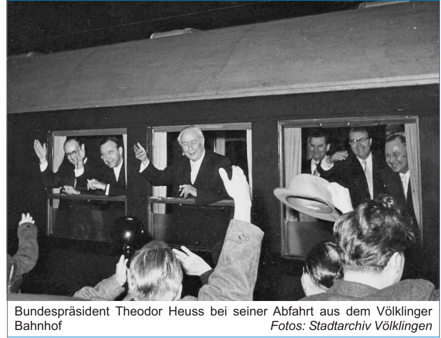
Bundespräsident Theodor Heuss bei seiner Abfahrt aus dem Völklinger Bahnhof