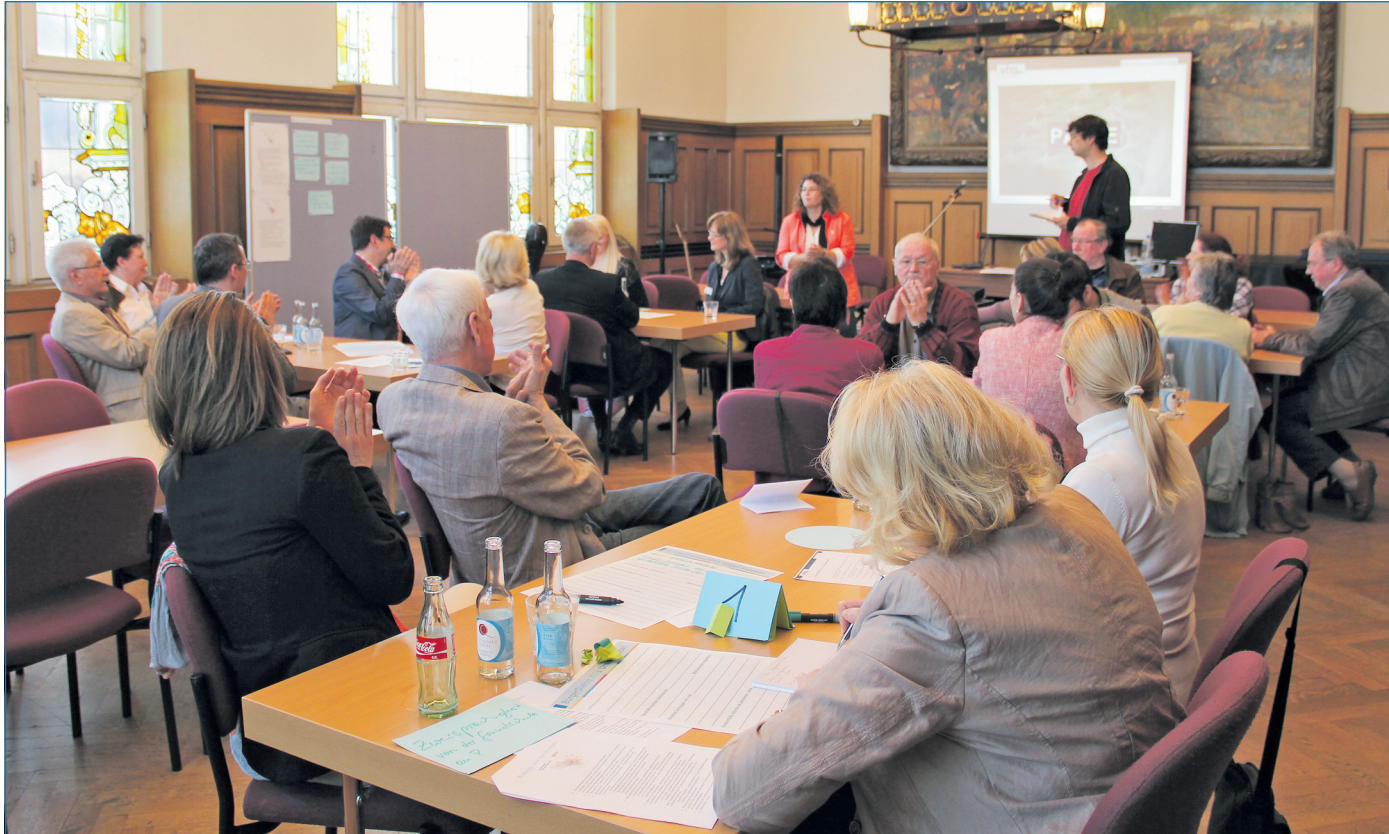
Im Alten Rathaus wurde fleißig diskutiert

IMPRESSUM Völklinger Stadtnachrichten Herausgeber: Stadt Völklingen Oberbürgermeister Klaus Lorig Rathausplatz, 66333 Völklingen Für unverlangt eingesandte Artikel übernimmt die Redaktion keine Haftung.