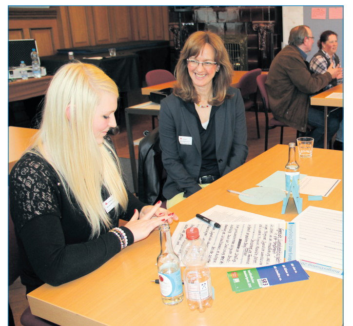
Diskussion in kleinen Gruppen