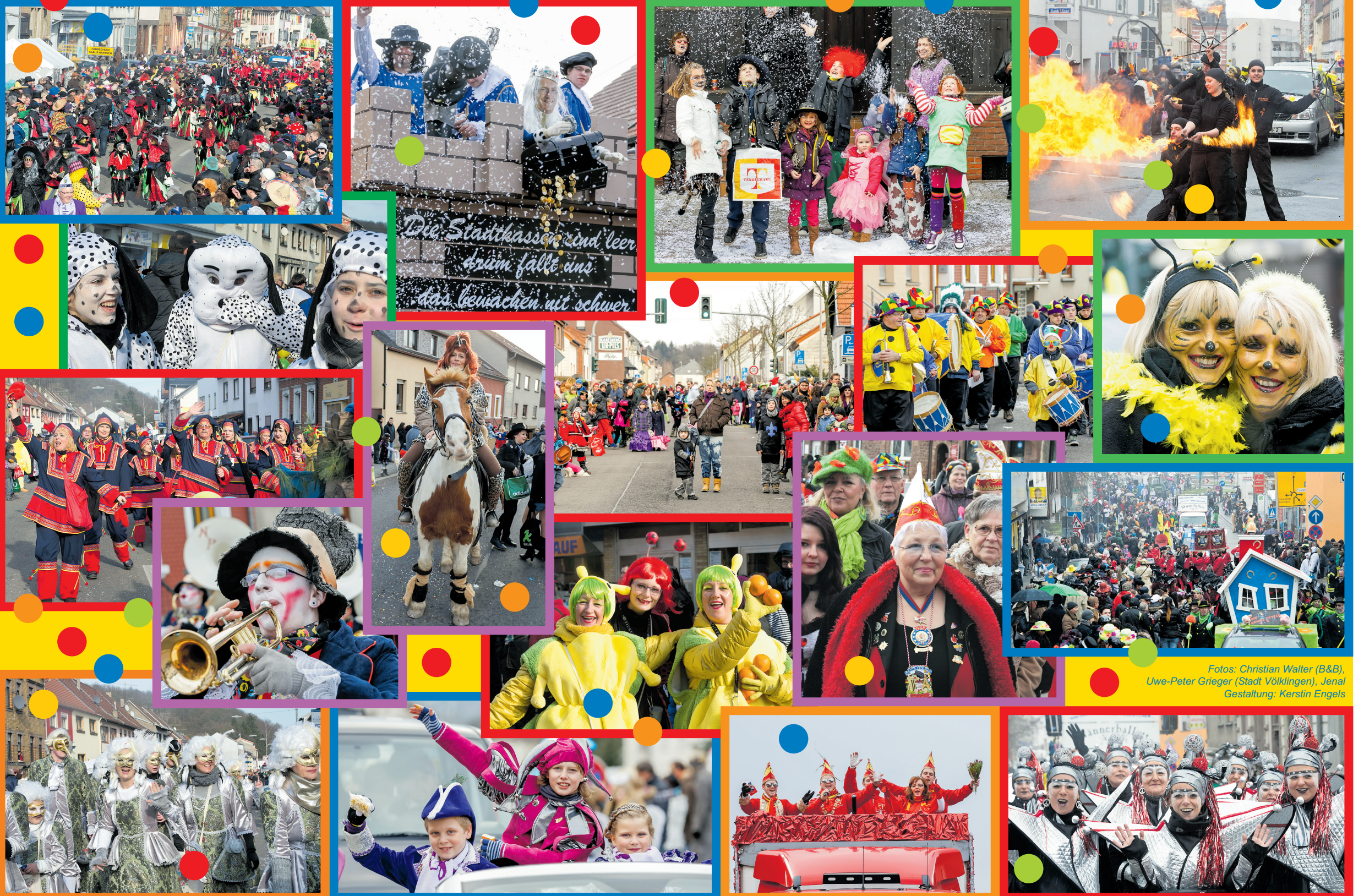
Fotos: Christian Walter (B&B), Uwe-Peter Grieger (Stadt Völklingen), Jena Gestaltung: Kerstin Engels

Eine kleine Narrenparade zum Rathaussturm und zu den Umzügen in Völklingen