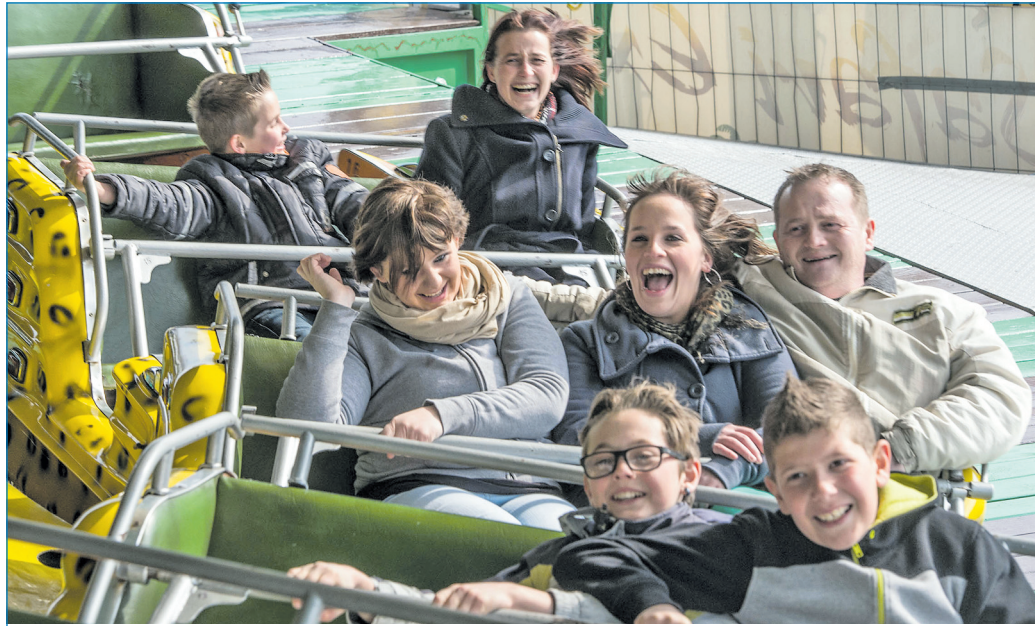
Am „Kindertag“ am 17. April fahren Kinder zum halben Preis.

Die Völklinger Osterkirmes beginnt in diesem Jahr am Samstag, dem 12. April, und dauert bis einschließlich 21. April. Fahrgeschäfte und Schausteller bieten bei dieser traditionellen Kirmes rund um das Neue Rathaus in der Völklinger Innenstadt alles vom Simulator „Hyper Coaster“ bis zum Pressluftflieger für Kinder. Für das neuntägige Spektakel haben sich siebenundzwanzig Fahrgeschäfte und Schausteller angemeldet. Zu den größten Fahrgeschäften werden in diesem Jahr ein Safari Express und ein Autoskooter gehören. Am Dienstag, den 15. April, ist „Familientag“, das bedeutet ermäßigte Fahr- und Spielpreise. Und am Donnerstag, den 17. April, ist „Kindertag“: Dann fahren alle Karussells zum halben Preis. Für die kleinen Besucherinnen und Besucher bietet die Völklinger Osterkirmes eine Kinderschleife, Kinderschiffschaukel sowie ein Bungee-Trampolin.