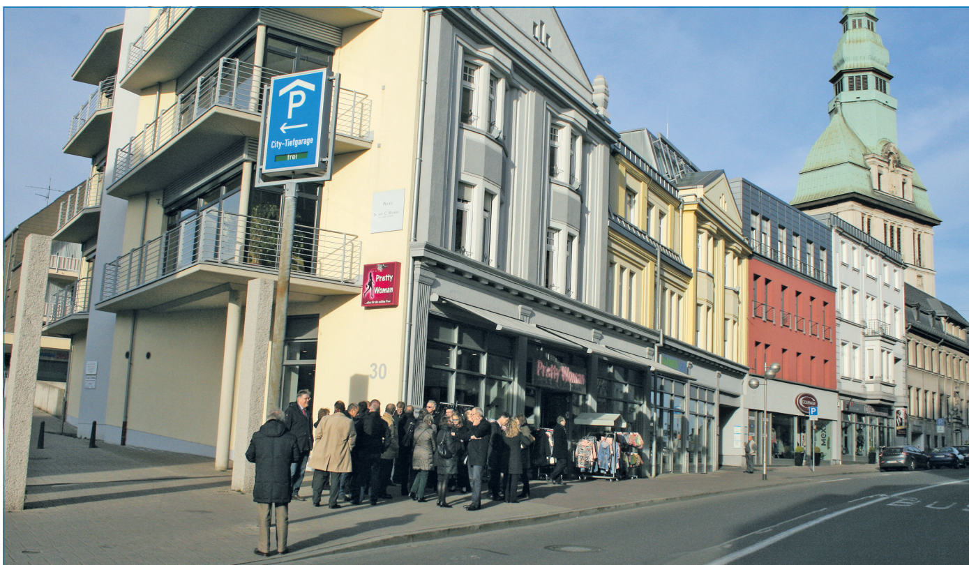
Beteiligte der Fachkommission Städtebau beim Rundgang vor den sanierten Jugendstilhäusern

gendstilhäuser sowie die Sanierung der Kulturhalle in Wehrden und deren Umfeldgestaltung. Gleichzeitig wurde den Besuchern deutlich vor Augen geführt, dass für die weitere nachhaltige Stadtentwicklung noch umfangreiche Fördergelder nach Völklingen fließen müssen.