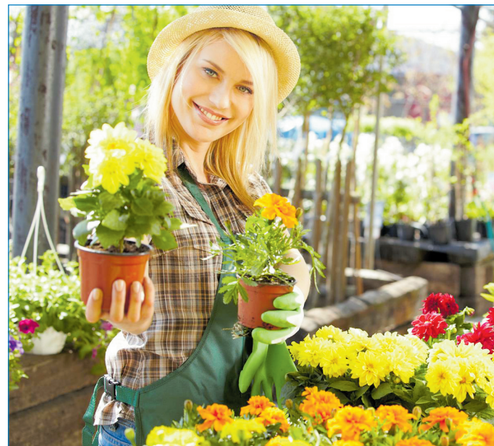
Herzlich eingeladen fühlt man sich von der Frau auf dem Plakat der Stadt Völklingen.