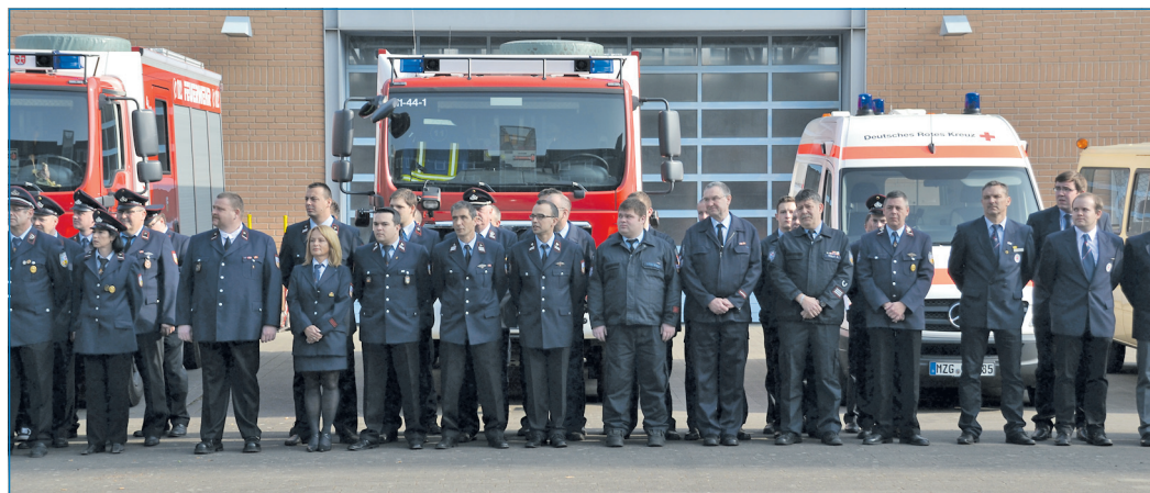
Beteiligte der saarländischen Feuerwehren bei der Feierstunde

Im Rahmen einer Feierstunde wurde bei der Landespolizeidirektion in Saarbrücken den saarländischen Einsatzkräften der Feuerwehren, die im vergangenen Jahr als Fluthelfer in Magdeburg eingesetzt waren, im Auftrag des Ministerpräsidenten von Sachsen-Anhalt Dr. Reiner Haseloff die Fluthelfernadel 2013 als Bandschnalle verliehen. Diese Bandschnalle kann als sogenanntes offizielles Ehrenzeichen an der Dienstuniform getragen werden. Die Völklinger Feuerwehr rückte mit insgesamt neun Mitgliedern im