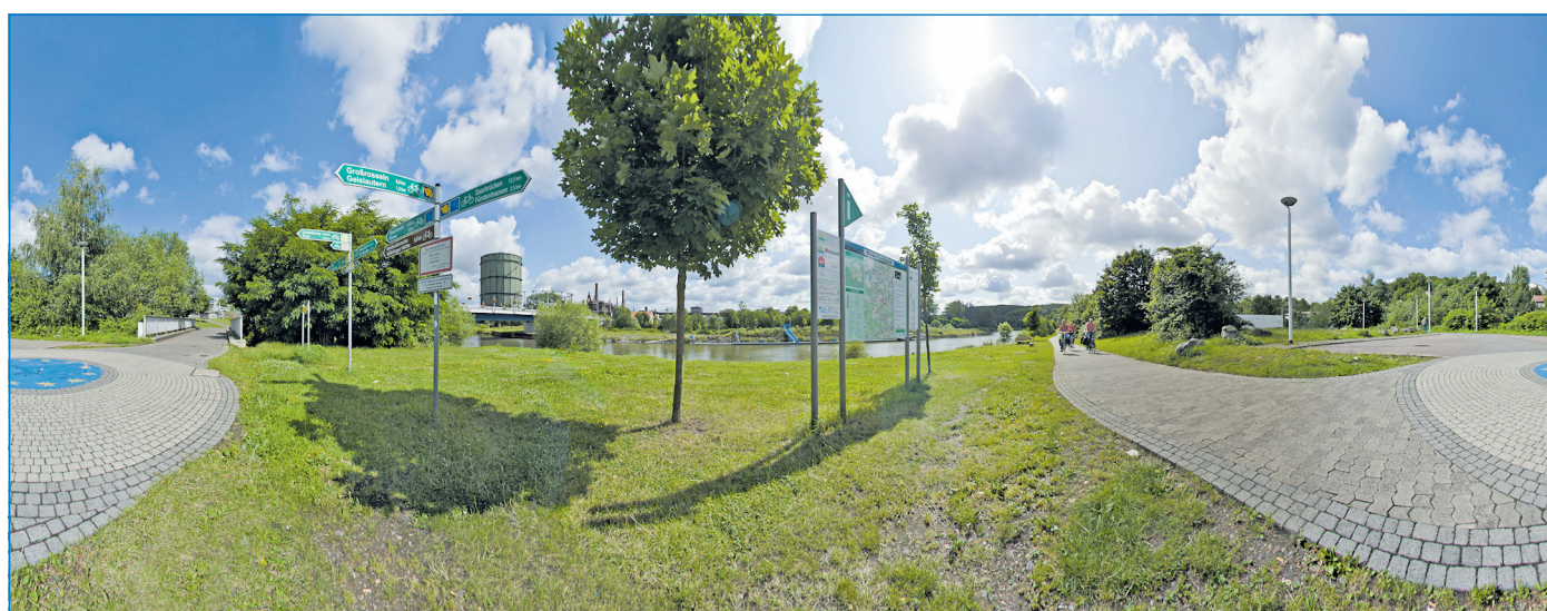
Neben Weltkulturerbe Völklinger Hütte und Forstgarten Karlsbrunn wird auch der Bereich um die Wehrdener Brücke eindrucksvoll im Web dargestellt.

360° Saar/Sarre – Per Mausklick auf und entlang der Saar unterwegs