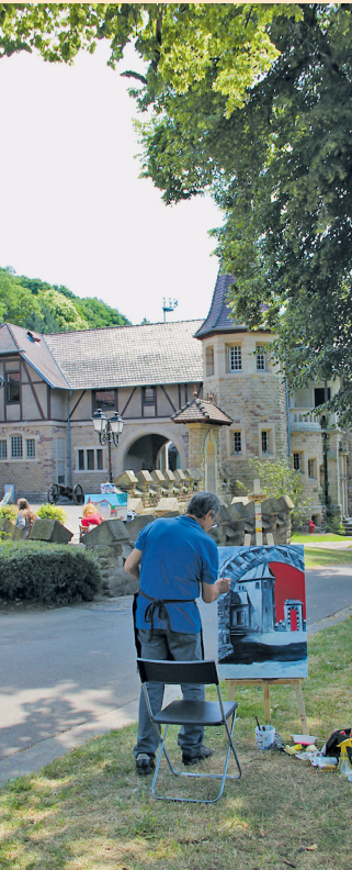
Blick auf den idyllischen Burghof in Forbach mit teilnehmenden Künstlern

Zum zehnten Mal fand das grenzüberschreitende Malfestival der Université Populaire Transfrontalière (UPT) Forbach-Völklingen und der VHS Völklingen statt. Im Jahr der 50-jährigen Jumelage trafen sich die rund zwanzig Künstlerinnen und Künstler aus der Grenzregion in der malerischen Umgebung des Burghofes in Forbach, wo sie sich bei optimalen Wetterbedingungen von stadtypischen Ansichten oder dem Park auf dem Schlossberg inspirieren ließen. Thema, Technik und Materialauswahl blieben den Kunschtchaffenden selbst überlassen und so entstanden viele interessante Arbeiten in Öl, Acryl, Kohle oder als Aquarell, auf Leinwand oder Papier. Während der Finissage übergaben die 1. Beigeordnete Thierry Homberg, Beigeordnete Carmen Harter-Houselle und VHS-Direktor Karl-Heinz Schäffner die Preise. Der 1. Preis mit 500 Euro dotiert ging an Ernest Barth, der 2. Preis mit 300 Euro dotiert an Pierrette Jäger, der 3. Preis mit 200 Euro dotiert an Lucien Maré. Der nächste Wettbewerb findet in zwei Jahren in Völklingen statt.