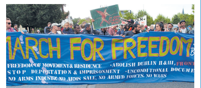
Marschieren für den Frieden: Bei der Aktion ging es auch durch Völklingen.