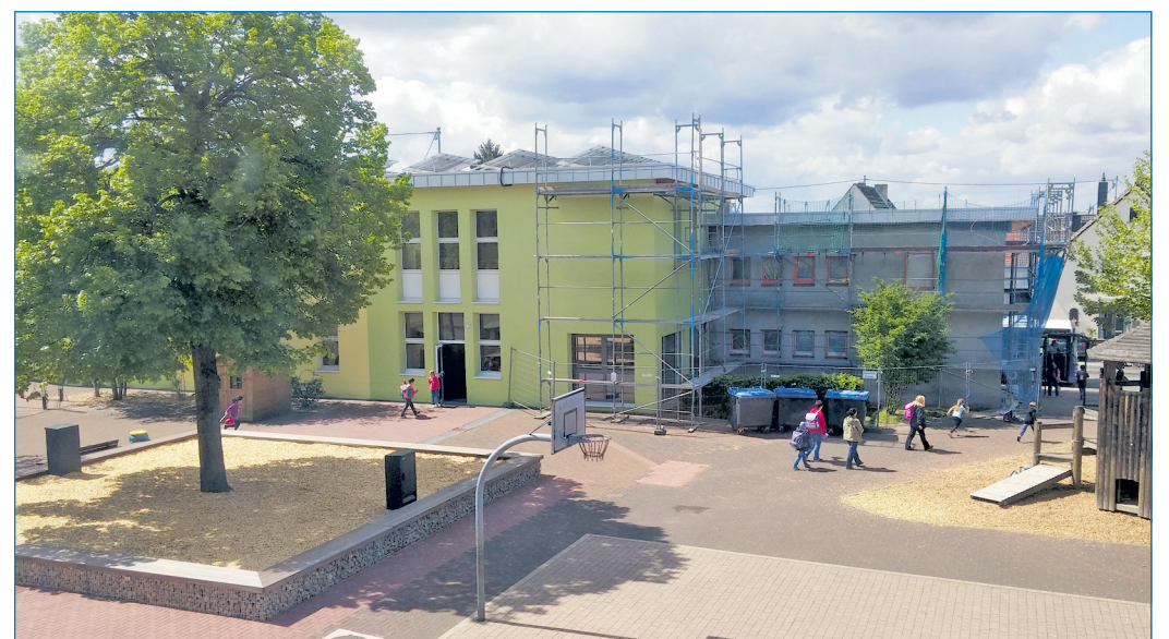
Blick auf das Gebäude der Nachmittagsbetreuung (links), das ehemalige Hausmeistergebäude (rechts) sowie den Schulhof der Grundschule Heidstock-Luisenthal

wurde das Gebäude mit einem äußeren Blitzschutz ausgestattet. Die Fassadenflächen des Osttraktes wurden mit einer 200 Millimeter dicken Steinwoll-dämmplatte und im Sockelbereich mit einer ebenso dicken Perimeterdämmung gedämmt. Für die Sanierungsmaßnahmen am Gebäude der Nachmittagsbetreuung und am ehemaligen Hausmeistergebäude wurden durch den Projektleiter Torsten Coenen Mittel in Höhe von 264.000 Euro umgesetzt. Der Zuschuss beträgt 104.497,75 Euro. Die Maßnahme dient der Substanzerhaltung des Schulgebäudes und der Energieeinsparung.