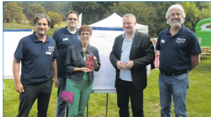
Ministerpräsidentin Annegret Kramp-Karrenbauer und Bildungsminister Ulrich Commerçon (2.v.l.) mit dem VHS-Team

am Steuer. Von 10 bis 14 Uhr moderiert RADIO SALÜ-Moderator Wettermüller. Natürlich kann man wieder an einem Gewinnspiel teilnehmen und drei Preise mit einem Wert von jeweils 100 Euro gewinnen. Also Vormerken: 3. VHS-Gesundheitstag am 12. September im Globus Baumarkt Völklingen.