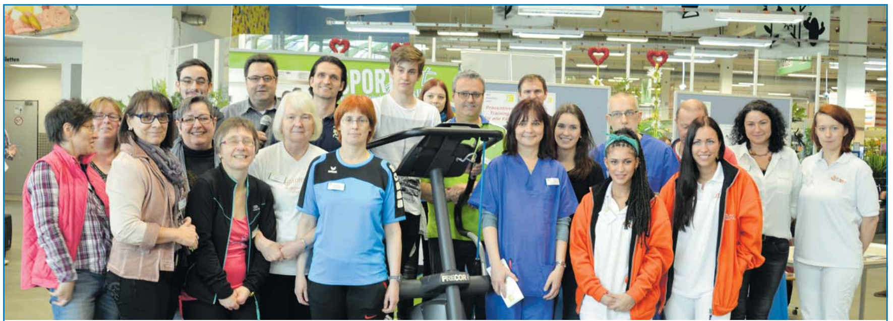
Teilnehmer des letzten VHS Gesundheitstages im Globus Baumarkt

duktion, Hightech-Schnitzeljagd mit GPS, Sinnes-Parcours, Kletterturm, Sprachspiele, Sportangebote, Naturerfahrungen und vieles mehr. Neben der traditionellen Lernfest-Tombola, einem Straßenkünstler und einer wandernden Musik erwartet die Besucher das Bildungsdorf mit vielen tollen Attraktionen. Das Lernfest zeigt, dass Lernen zu einem Ort, an dem Interessierte aller Altersgruppen experimentieren und Erfolge machen Lernen zu einem Erlebnis. Nicht nur Altbekanntes erscheint in einem neuen Licht, die Besucher haben auch die Möglichkeit, ganz neue Dinge auszuprobieren und an außergewöhnlichen aber auch abenteuerlustigen Aktionen teilzunehmen. Weitere Informationen unter www.lernfest-saar.de . Veranstalter des Lernfestes sind das Ministerium für Bildung und Kultur, das Ministerium für Wirtschaft, Arbeit, Energie und Verkehr, die Landeshauptstadt Saarbrücken und das BildungsnetzSaar.