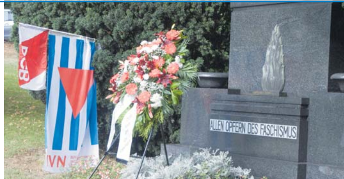
Nach einer Kranzniederlegung im Schillerpark wird am Antikriegstag die Ausstellung (Foto links) des Netzwerkes für Demokratie und Courage Saar im Foyer des Neuen Rathauses zu sehen sein.