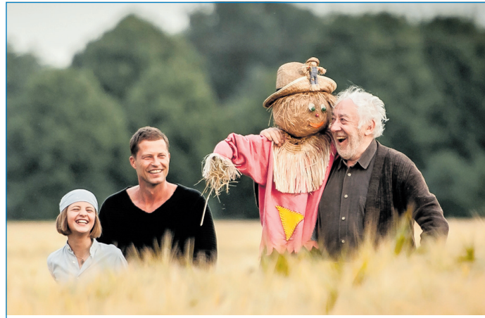
Dieter Hallervorden (rechts) spielt in dem Film eine der Hauptrollen.

Im Rahmen der Veranstaltungsserie „Lernort Kino“ wird am 18. November in Völklingen mit dem Film „Honig im Kopf“ eine Vorführung für Senioren angeboten. Der Film „Honig im Kopf“, eine Tragikomödie mit Dieter Hallervorden und Emma Schweiger, erzählt die Geschichte des an Alzheimer erkrankten Großvaters Amandus, der zunehmend vergesslicher wird und sich zu Hause nicht mehr zurechtfinden scheint. Für das in die Jahre gekommene Familienoberhaupt stehen daher alle Zeichen auf Seniorenheim. Niko, der Vater von Tilda und Sohn von Amandus, hält es für das