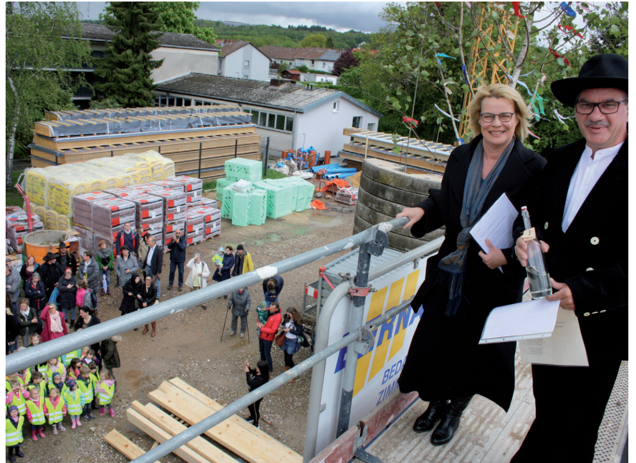
Oberbürgermeisterin Christiane Blatt mit Roland Bernarding beim Richtfest in der Rheinstraße

„Wir werden bei der Errichtung dieses Baus ganz besonderen Wert auf energetische Nachhaltigkeit legen“, sagte Christiane Blatt. Das Gebäude in Passivhausstandard wird Fenster mit einer dreifachen Wärmeschutzverglasung, Außenwände mit