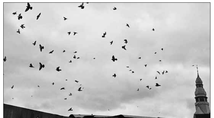
Tauben über Völklingen